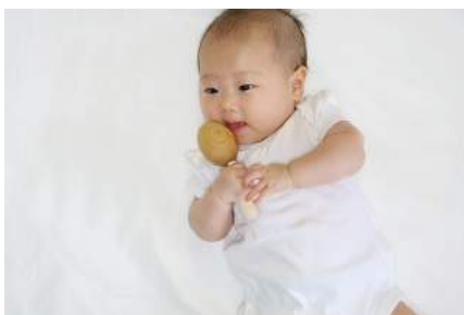
無塗装仕上げのため、赤ちゃんがなめても安心安全です。