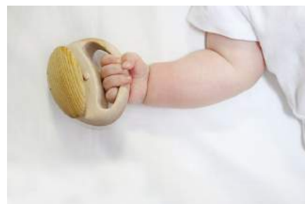
アシンメトリーな形が、赤ちゃんの手にフィットします。