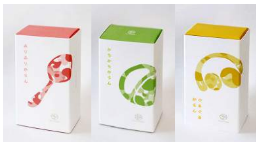
ギフトとしても喜ばれる、お菓子のようパッケージが特徴です。